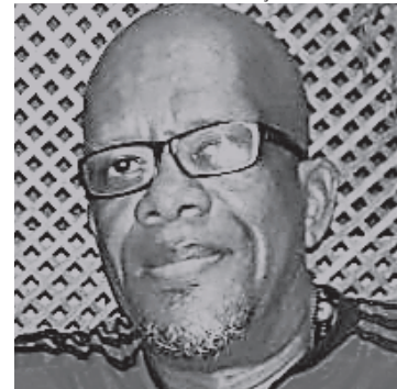
Ykenga sofreu um infarto